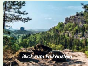
Blick zum Falkenstein