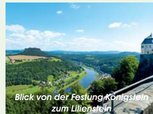
Blick von der Festung Königstein zum Lilienstein